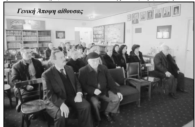
Γενική Άποψη αίθουσας