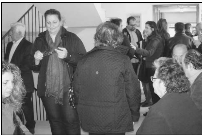
Εντυπωσιακή ήταν η συμμετοχή των πατριωτών στις αρχαιρεσίες του Συνδέσμου μας.