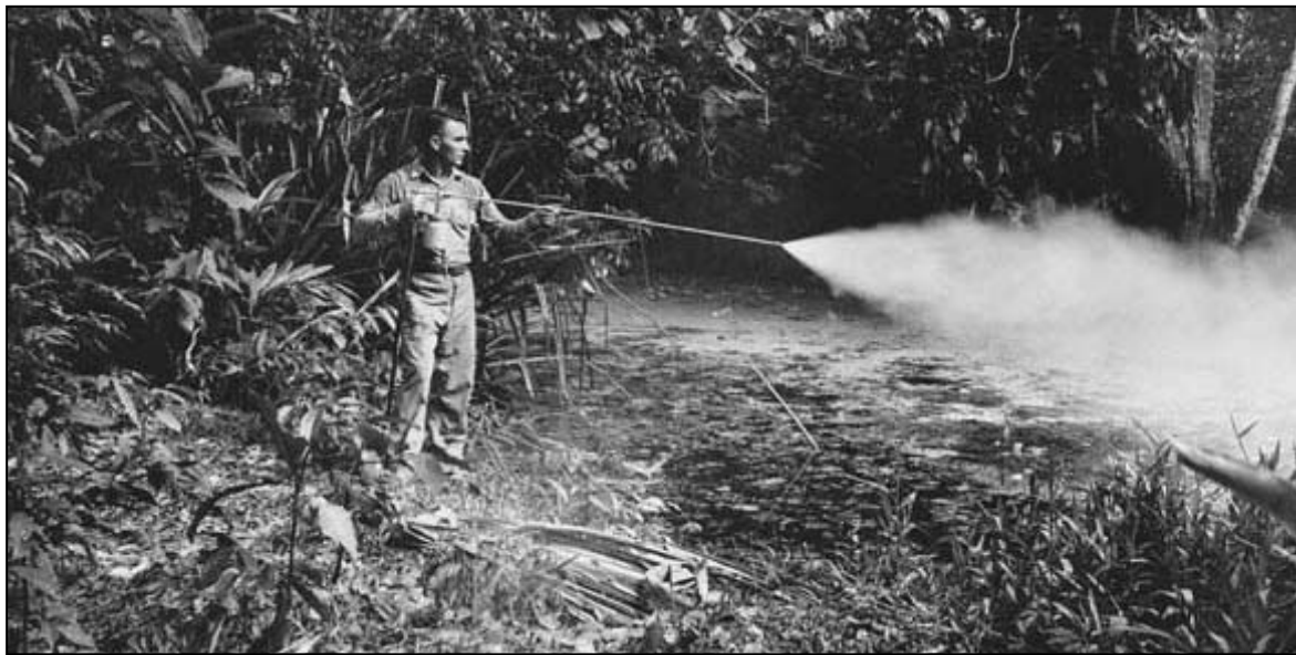
Ψεκασμός στην ύπαιθρο με DDT

Από τις στατιστικές των πρώτων δεκαετιών του περασμένου αιώνα μαθαίνουμε ότι στον πληθυσμό των 7 εκατ. κατοίκων της χώρας, ο αριθμός αυτών που κάθε χρόνο προσβάλλονταν από ελονοσία ήταν 1.200.000 και οι θάνατοι από τη νόσο κατά μέσο όρο 5.032 κάθε χρόνο, από τους οποίους περίπου το 70% ήταν παιδιά, ενώ οι επιπτώσεις στη γενική υγεία του πληθυσμού και την οικονομία της χώρας ήταν πολύ μεγάλες. 7