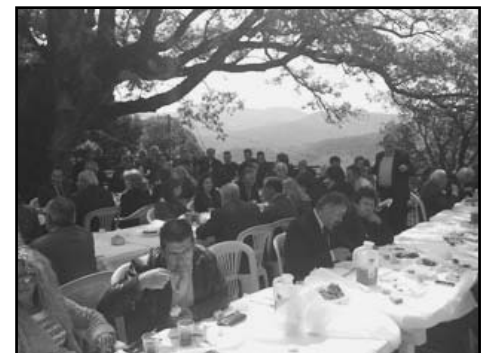
Προσηλωμένοι όλοι στο φαγητό!