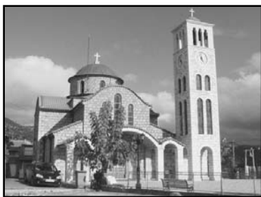
Ο Ιερός Ναός Κοιμήσεως της Θεοτόκου