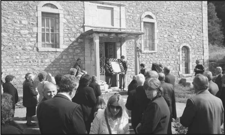
Η ιερή εικόνα της Ζωοδόχου Πηγής κατά την επιστροφή της στον ναό μετά την περιφορά στον περίξ χώρο.

Ακολούθησε λιτάνευση της ιεράς εικόνας της Παναγίας μέχρι το προαύλιο της εκκλησίας της Κοιμήσεως της Θεοτόκου. Μετά το αντίδωρο και τη διανομή του αγιασμένου άρτου ο Σύνδεσμος είχε φροντίσει για ένα όμορφο γλέντι στο προαύλιο της εκκλησίας, που συνοδεύταν από ψητή γουρουνόπουλα, τυριά, πασχαλινά αβγά και κουλούρια μαζί με γλυκόπιτο κρασί. Φυσικά δεν μπορούσε να λείπει ο χορός και το τραγούδι. Οι φωτογραφίες αποτυπώνουν με ζωντάνια όλη την κεφάτη ατμόσφαιρα.