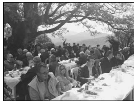
Εν αναμονή των εδεσμάτων οι παρέες, στη σκιά της αιωνόβιας βελανιδιάς.