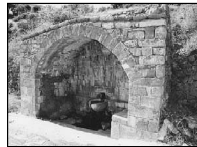
Η Πηγή του Δεμοκίτη

Ετ. 35ο • Αρ. φ. 182 • Απρίλιος-Μάιος-Ιούνιος 2011 • ιστοσελίδα: servou.gr • email: syndesmos@servou.gr