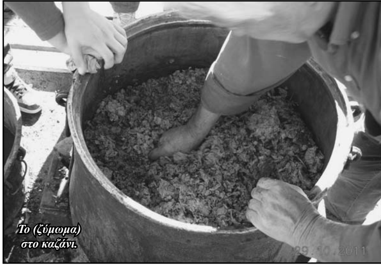
Το (ζύμομα) στο καζάνι.