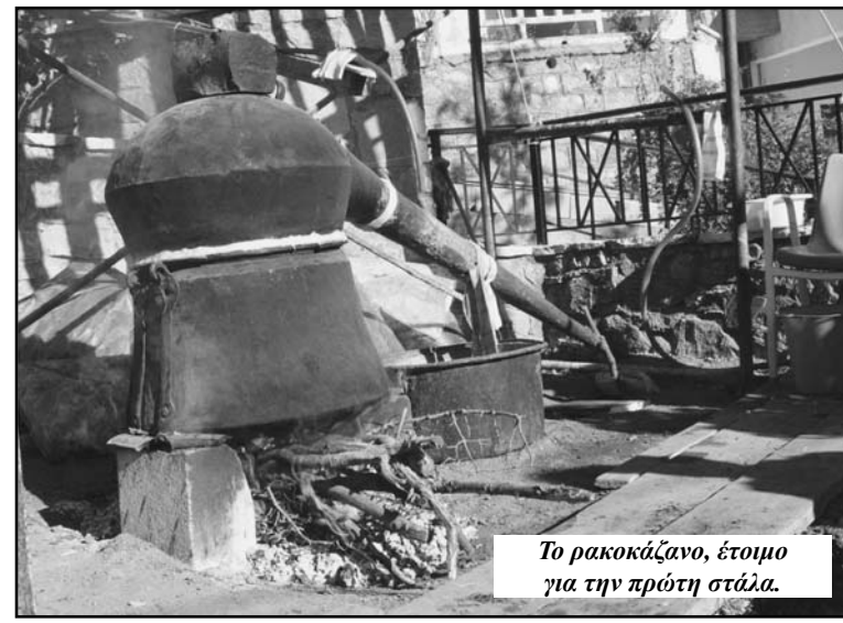
Το ρακοκάζανο, έτοιμο για την πρώτη στάλα.

(στράγγισμα) τον μούστο. Σε άλλες περιοχές της Ελλάδας τα τσίπουρα τα έλεγαν στέμφυλα, έτσι γράφουν και τα βιβλία, λέξη φυσικά άγνωστη εκείνα τα χρόνια στους Σερβαίους.