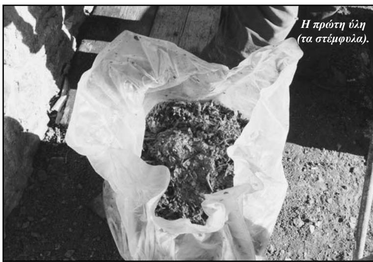
Η πρώτη ύλη (τα στέμφυλα).