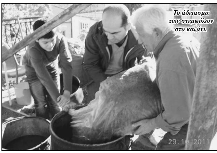
Το άδειασμα των στέμφυλων στο καζάνι.