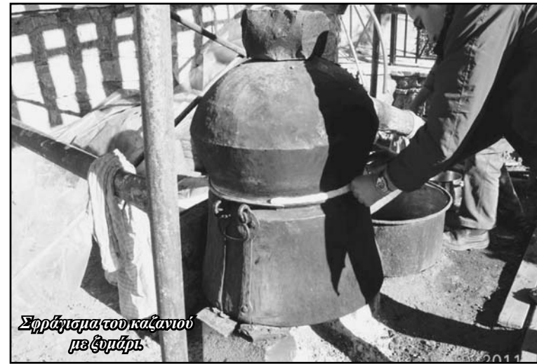
Σφράγιση του καζανιού με ζυμάρι.