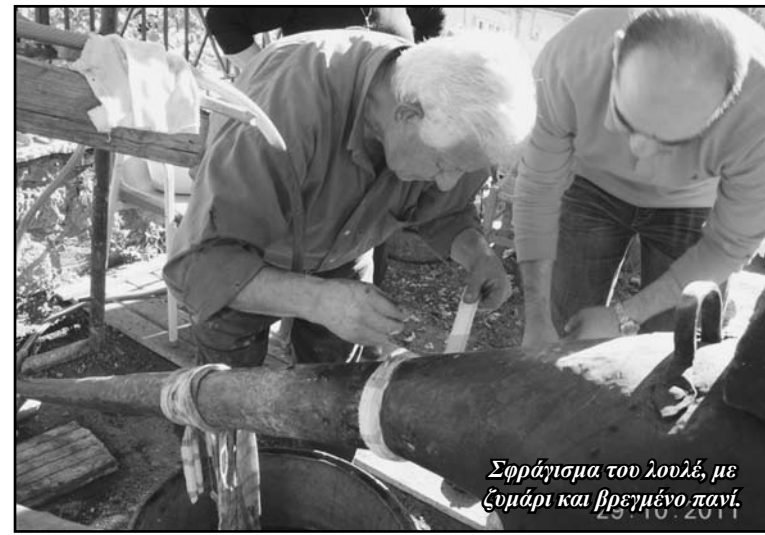
Σφράγιση του λουλέ, με ζυμάρι και βρεγμένο πανί.