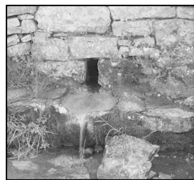
Η βρύση στον Άγιο Δημήτριο

Έτ. 35ο • Αρ. φ. 186 • Απρίλιος - Ιούνιος 2012 • ιστοσελίδα: servou.gr • email: syndesmos@servou.gr