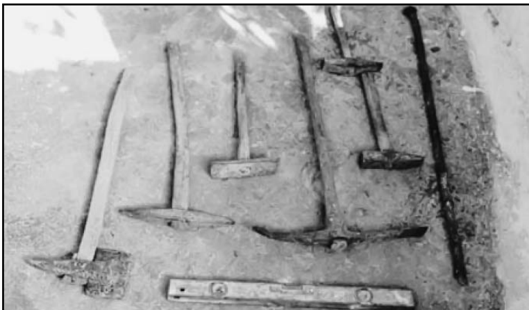
ΑΤΟΜΙΚΑ ΕΡΓΑΛΕΙΑ ΠΕΤΡΑΛΩΝ, ΜΠΗΑΚΟΥΝΙ, ΜΑΤΡΑΠΑΣ, ΚΑΛΕΜΙ, ΚΟΥΣΚΟΥΛΑ, ΤΣΑΠΡΑΚΙ, ΞΥΛΙΝΟΣ ΜΑΤΡΑΚΑΣ, ΣΟΚΚΟΣ, ΚΟΠΑΝΟΣ, ΒΕΛΟΝΙ, ΑΛΦΑΔΙ.

Μια από τις ημέρες που δεν δούλευαν, λόγω αργίας, συμφώνησαν να πάνε όλοι μαζί στη Λαμία για να φωνίσουν αλλά και να καθίσουν