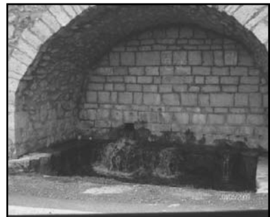
Η Τρανιά Βρύση

Έτ. 35ο • Αρ. φ. 188 • Οκτώβριος - Δεκέμβριος 2012 • ιστοσελίδα: servou.gr • email: syndesmos@servou.gr