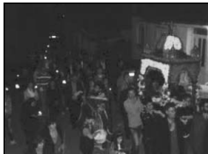
Η Μεγάλη Παρασκευή είναι πένθιμη και λυπητερή ημέρα, αλλά και η πιο ιερή, η πιο αγία, η πολυσεβαστή και πλέον αγαπητή και προσκυνητή ημέρα της Εκκλησίας μας.