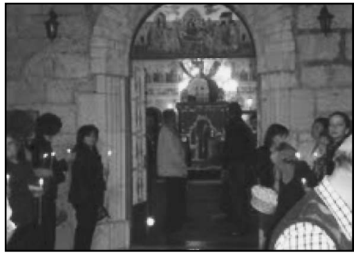
Θεοφύλακτο και τον επιτάφιο, και στη συνέχεια ακολουθούσαν όλοι οι κάτοικοι του χωριού και οι επισκέπτες. Στην διάρκεια της μεταφοράς του επιταφίου έγιναν δύο - τρεις στάσεις που όχι μόνο οι ψάλτες, αλλά και όλος ο κόσμος έψελνε το Κύριε ελέησον, τρεις φορές. Μακάρι να αξιωθούμε και του χρόνου όλο και περισσότεροι πατριώτες να παρευρεθούμε.