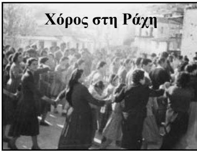
Χόρος στη Ράχη

Έτ. 37ο • Αρ. φ. 191 • Απρίλιος - Ιούνιος 2013 • ιστοσελίδα: servou.gr • email: syndesmos@servou.gr