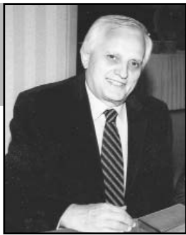
Γράφει ο Βασίλειος Κων/ντή Σχίζας

Οι Αρκάδες γιόρτασαν με λαμπρή εκδήλωση την 192 η επέτειο της Άλωσης της Τριπολιτσάς και απέδωσαν, στους προγόνους μας Επαναστάτες του 21, ελευθερωτές της πατρίδας και στον εμβληματικό ηγέτη Γέρο του Μωριά, Θεόδωρο Κολοκοτρώνη , υψίστημη και ελάχιστο από το χρέος στην ιερή μνήμη τους.