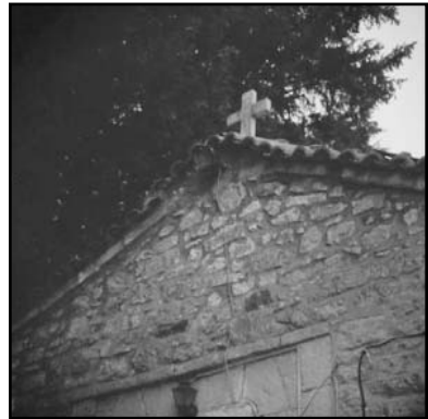
Αποψη της Αγίας Παρασκευής

Έτ. 37ο • Αρ. φ. 192 • Ιούλιος - Σεπτέμβριος 2013 • ιστοσελίδα: servou.gr • email: syndesmos@servou.gr