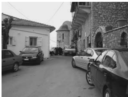
Σπίτια στην κεντρική πλατεία του χωριού.