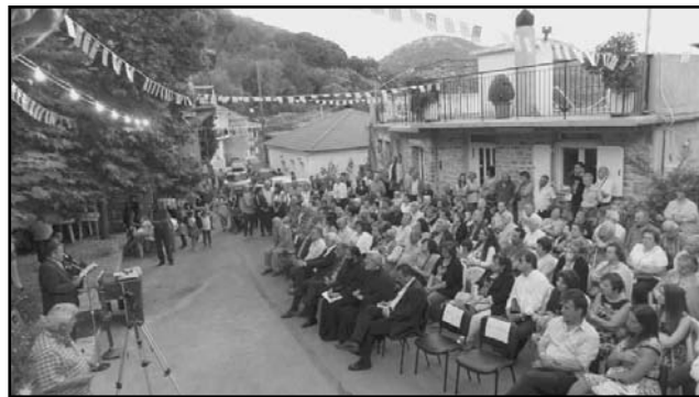
Αθρόη η προσέλευση των συμπατριωτών στην εκδήλωση μνήμης

Χαρακτηριστικά παραθέτουμε το κείμενο του site http://www.arcadiaportal.gr/