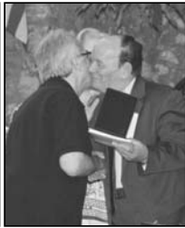
Απονομή τιμητικής πλακέτας-μεταλλίου στον πρόεδρο της ΓΣΕΕ, κ. Γ. Παναγόπουλο.

της ΓΣΕΕ κ. Γιάννης Παναγόπουλος. Ο Καθηγητής Ιατρικής κ. Γεώργιος Τρουπής. Ο βουλευτής Αρκαδίας κ. Κώστας Βλάσης. Ο δήμαρχος Ηλείου κ. Νίκος Ζενέτος.