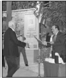
Απονομή τιμητικής πλακέτας-μεταλλίου στον Περιφερειάρχη Πελοποννήσου κ. Τατούλη