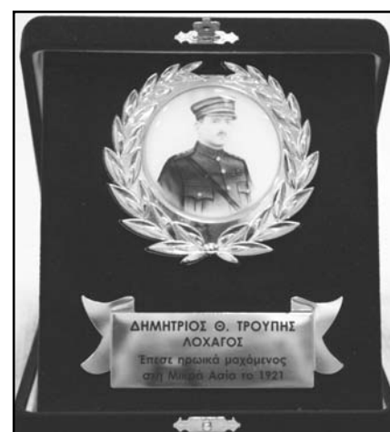
Αναμνηστική πλακέτα-μετάλλιο, που δόθηκε στους επισήμους

Στο τέλος, παρετάθη δεξίωση σε όλους τους παρευρισκόμενους, από τον Καθηγητή Ιατρικής κ. Γεώργιο Θ. Τρουπή.