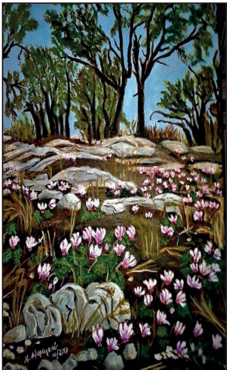
Λόφος με κυκλάμινα Έργο Μαρίας Μαραγκού