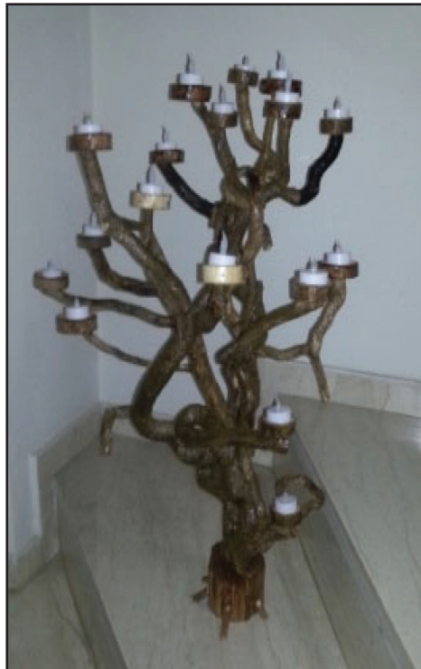
Έργο Τάκη Δημητρόπουλου Συλογλυπτική-φωτιστικό