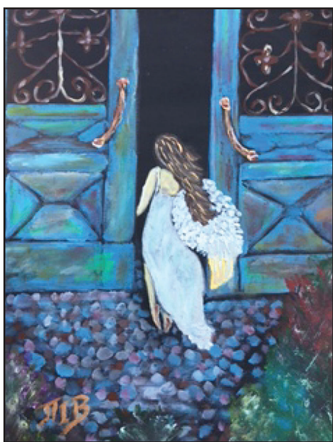
Τα παιδιά μας άγγελοι στην πόρτα μας Έργο Παναγιώτας Ι. Βέργου

Στα παιδιά μας ας χαρίζουμε εφόδια και ευχές, που θα γίνονται λουλούδια στην ψυχή τους και δύναμη για το ταξίδι της ζωής.