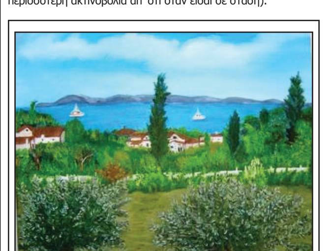
Αγναντεύοντας τη θάλασσα στον Σαρωνικό. Έργο Μαρίας Χρ. Μαραγκού.

• Μην το χρησιμοποιείς μέσα σε κινούμενο όχημα (δέχεσαι πολύ περισσότερη ακτινοβολία απ' ότι όταν είσαι σε στάση).