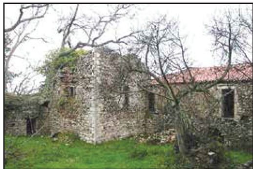
Το ποργόσπιτο των Πλαπουταίων στον Παλούμπα όπως ήταν πριν την ανακαίνισή του το 2015.

Υγιαίνει εν αγαθοίς. Τη 2 Ιουνίου 1821, Ζαράκοβα Τρικόρφων Ο αδελφός σας, Θεόδωρος Κολοκοτρώνης Εκεί τραυματίστηκε και ο Ηλίας Σχίζας. Του βγάλανε το δεξιό μάτι οι Τουρκαλβανοί του Λάλα. Ο ερευνητής Βασίλης Δάρας πήρε τις πρώτες πληροφορίες για τον Ηλία από τον απόγονό του Κων/ντή Σχίζα και τις τεκμηρίωσε από τα Αρχεία του Κράτους. Τις παραθέτουμε: