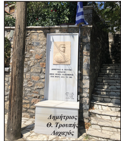
Δημήτριος Θ. Τρουπής Λοχαγός

Έτ. 45ο • Αρ. φ. 221 • Απρίλιος - Μάιος - Ιούνιος 2021 • Ιστοσελίδα: servou.gr • FB: Σύνδεσμος Απανταχού Σερβαίων